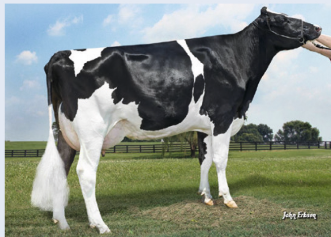
Akiro-Red-Urgroßmutter Morningview Destry Lori