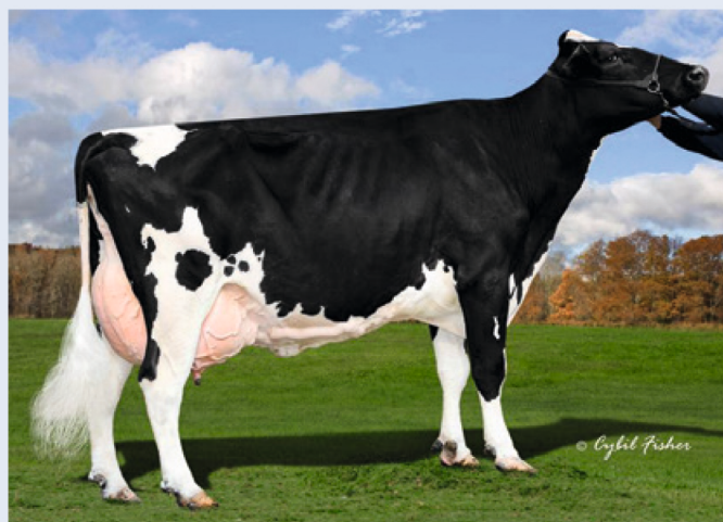
Stammkuh Clear Echo Ramo 61765028, EX-94