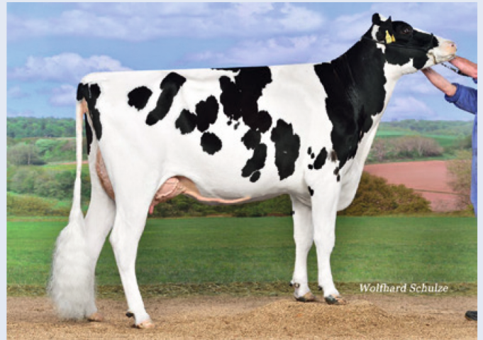
Gypsy-Mutter Georgia 03.58665654